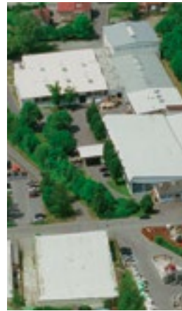
Hauptsitz in Güglingen