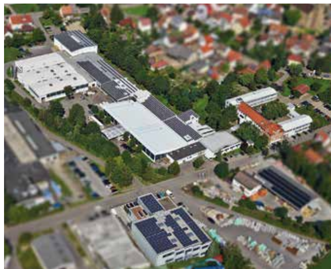
Hauptsitz in Güglingen